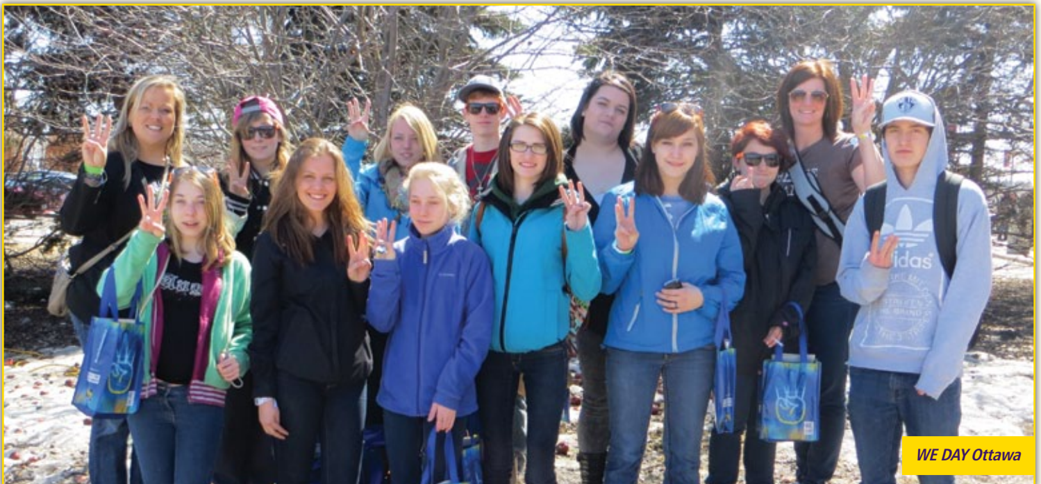
WE DAY Ottawa