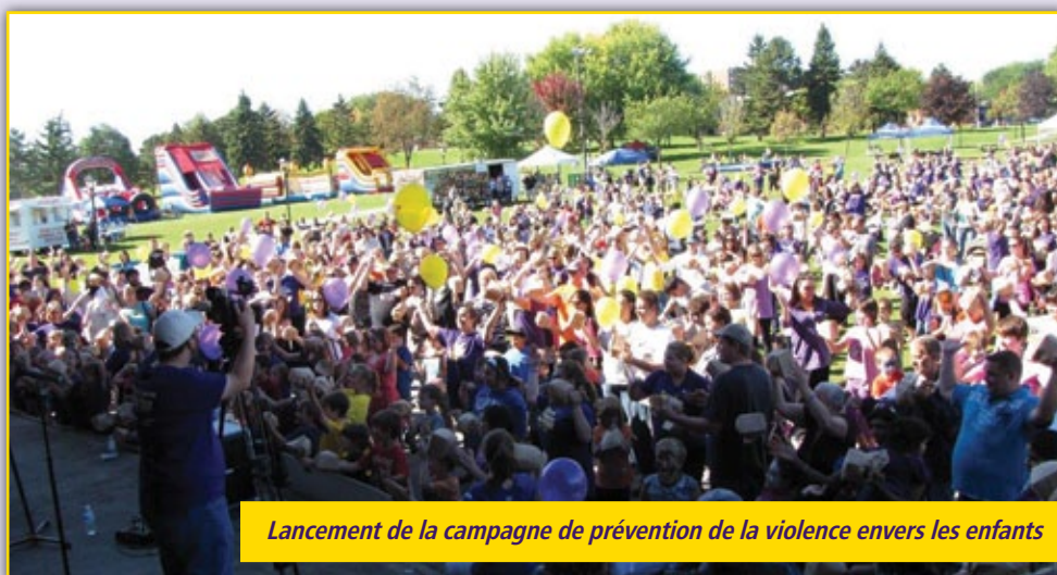
Lancement de la campagne de prévention de la violence envers les enfants

Eh bien, Stormont, Dundas et Glengarry, nous avons réussi! Le message « Brisez le silence, parlez pour eux » a été entendu clairement!