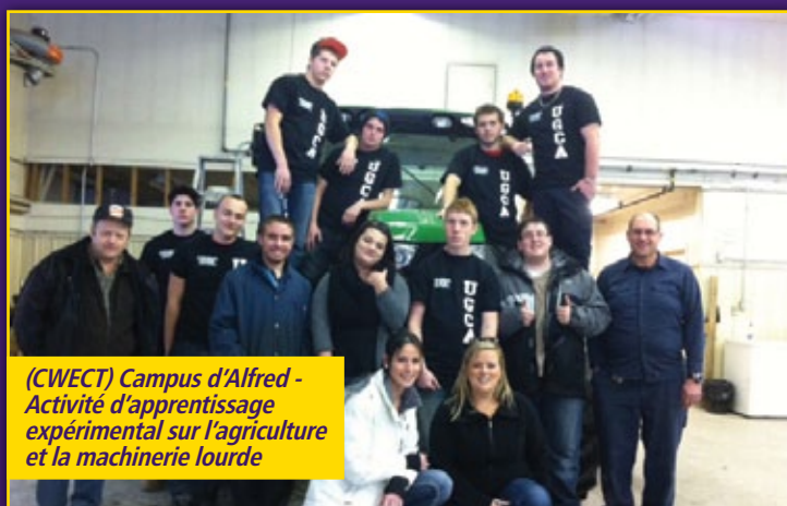
(CWECT) Campus d'Alfred - Activité d'apprentissage expérimental sur l'agriculture et la machinerie lourde

LES ENFANTS ET LES JEUNES QUI ONT BÉNÉFICIÉ DU SOUTIEN D'UN CONSEILLER PÉDAGOGIQUE OU D'UN TUTEUR ONT DÉMONTRÉ LES SIGNES D'UNE AUGMENTATION DE LEUR ESTIME DE SOI, DE LEUR ENGAGEMENT, ET DE LEUR MOTIVATION À APPRENDRE.